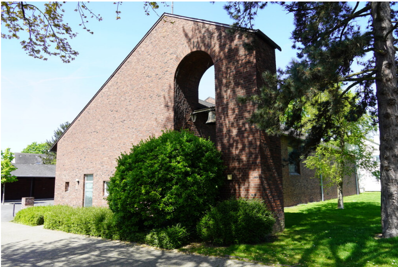
Kirche St. Bonifatius in Krefeld Fischeln-Stahldorf (2023)