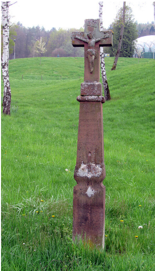
Frontalansicht des Schaftkreuzes bei der Spitzstraße in Kenn (2023)