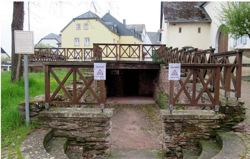
Keller einer römischen Villa in Kenn (2023)