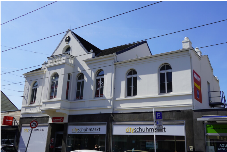
Wohnhaus und Brotfabrik von C. Hauses + Co. in Krefeld-Fischeln (2023)