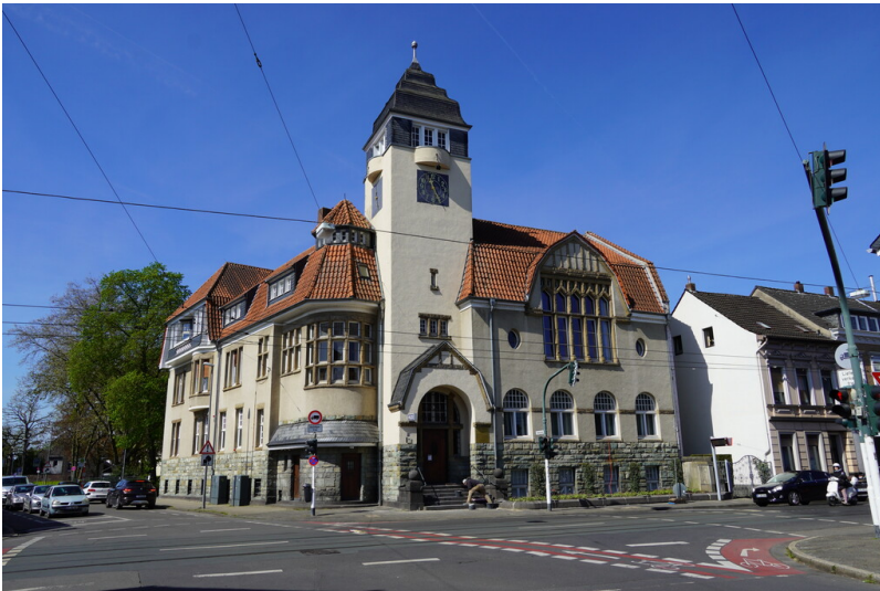
Rathaus in Krefeld-Fischeln (2023)