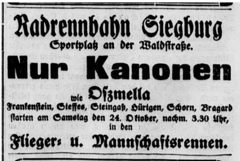
Ausschnitt aus dem General-Anzeiger vom 22. Oktober 1925: Anzeige für ein Rennen auf der Radrennbahn Siegburg auf dem Sportplatz an der Waldstraße.