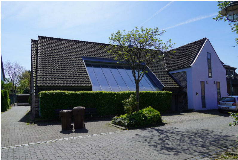
Diebershof in Krefeld-Fischeln (2023)