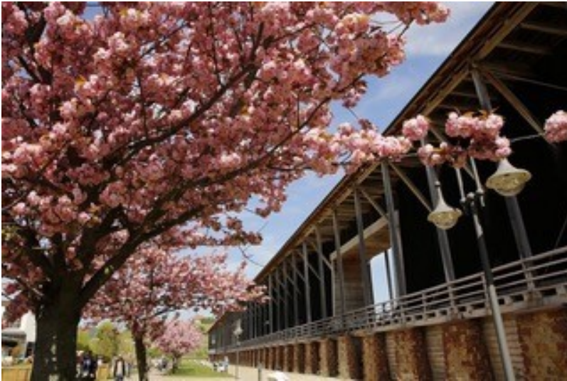
Gradierbau in Bad Dürkheim