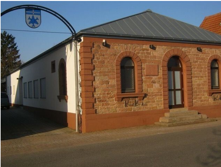
Dorfgemeinschaftshaus mit Brunnen in Großfischlingen