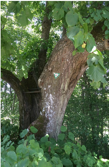
Wilsecker Linde (2015)