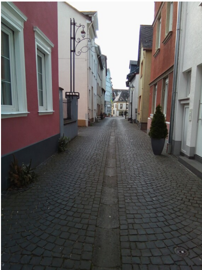
Binger Gasse in Boppard