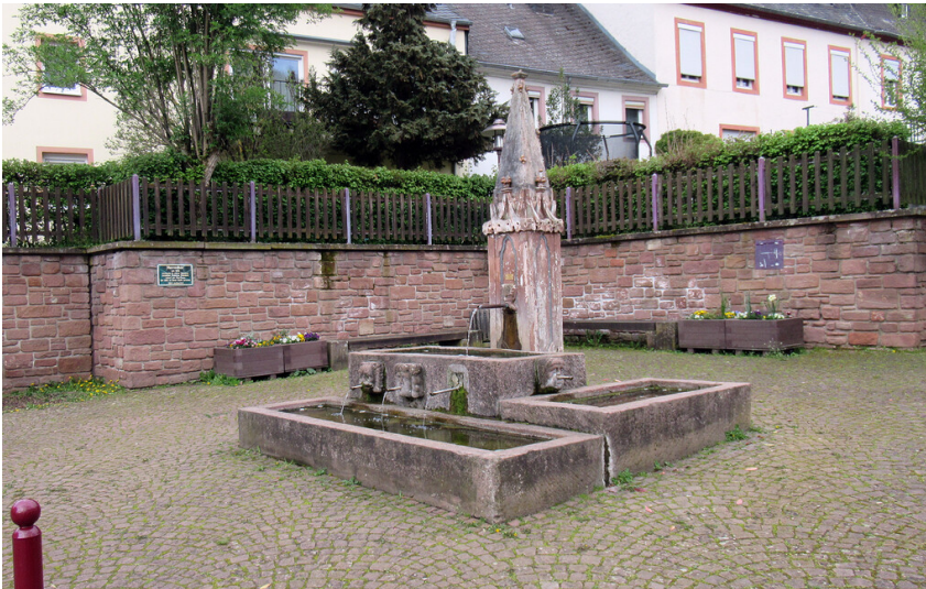
Herrenbor in Kenn