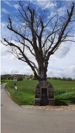
Marienkapelle in Eschweiler vor landschaftsprägendem Einzelbaum (2023).