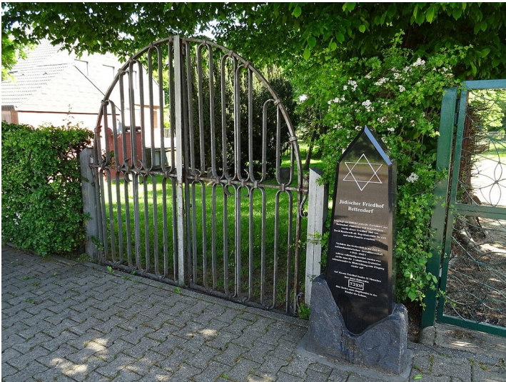
Der Eingangsbereich zu dem jüdischen Friedhof in Alsdorf-Bettenheim, rechts im Bild der Gedenkstein (2020).