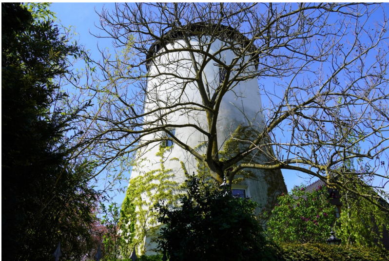
Ehemalige Windmühle in Krefeld-Fischeln (2023).