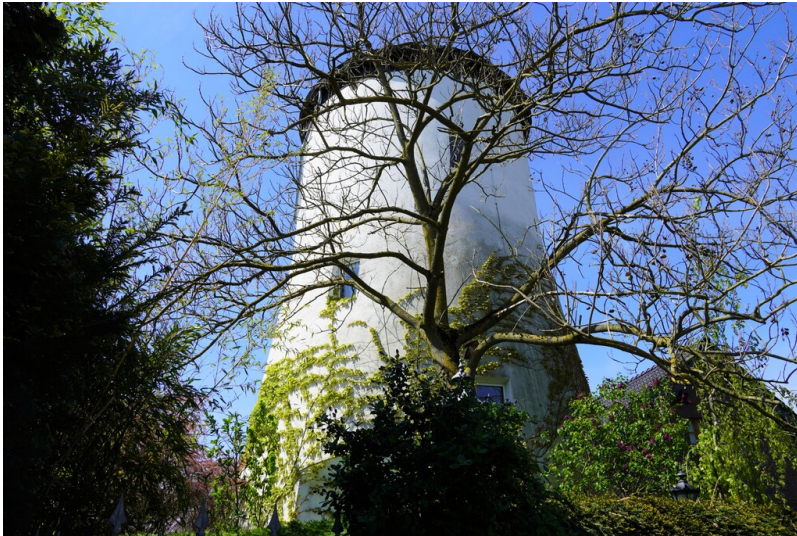
Ehemalige Windmühle in Krefeld-Fischeln (2023).