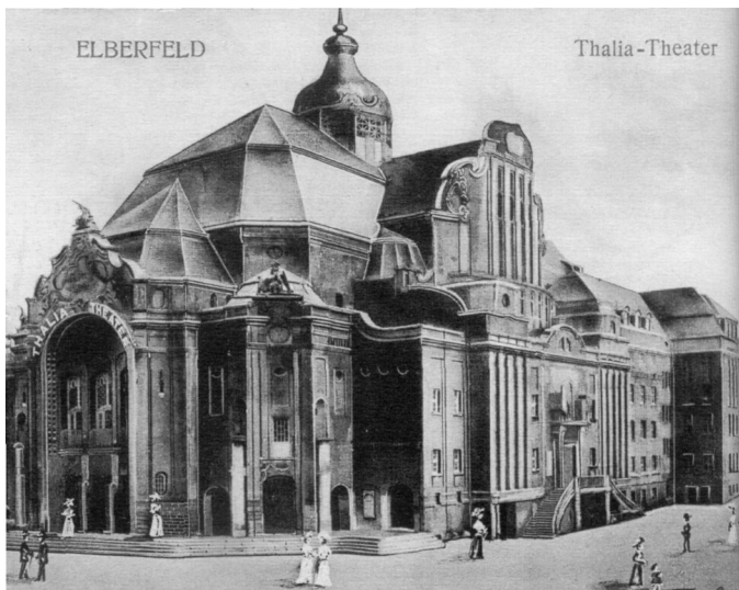
Thalia-Theater in Wuppertal 1906