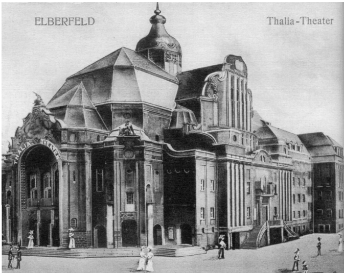
Thalia-Theater in Wuppertal 1906