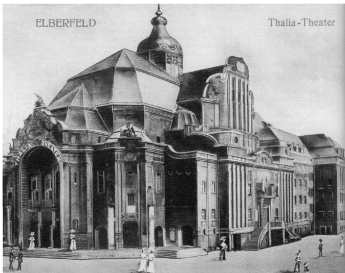
Thalia-Theater in Wuppertal 1906