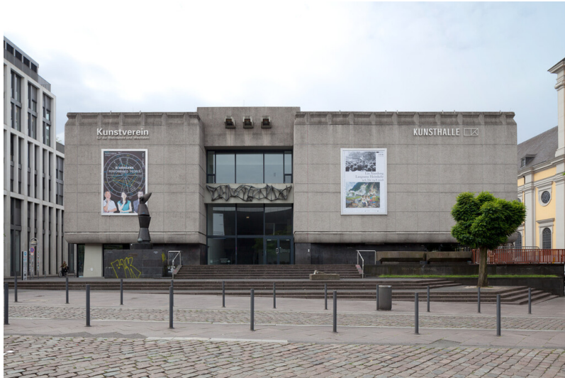
Frontansicht Kunsthalle (2018)