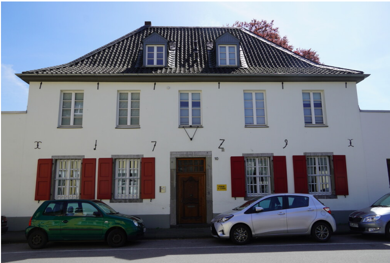
Pfarrhaus der Kirche St. Clemens in Krefeld-Fischeln (2023)