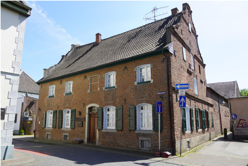
Bäkerhof in Krefeld-Fischeln (2023)