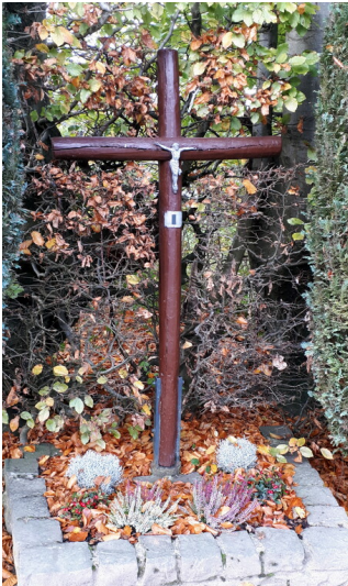
Simmerather Kreuzweg, Station 1 (2023)