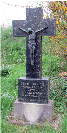
Frontansicht Unfallkreuz Am Kenner Haus (2023)