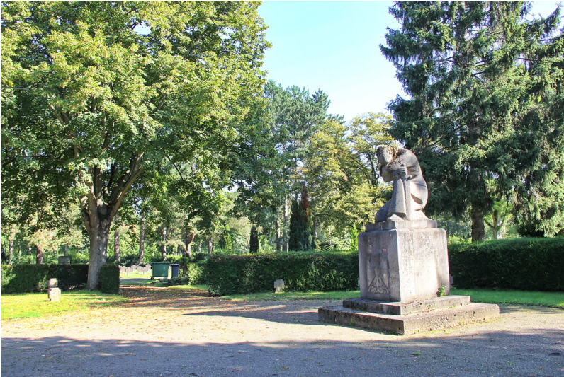
Transloziertes Kriegerehrenmal auf dem Friedhof "Platanenweg" in Bonn-Beuel