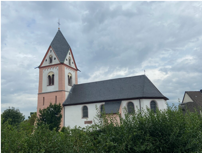
Die katholische Kirche St. Michael in Köln-Zündorf, Blick in Richtung Norden (2023).