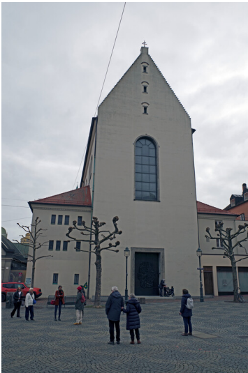
Katholische Pfarrkirche Sankt Moritz in Augsburg (2023)