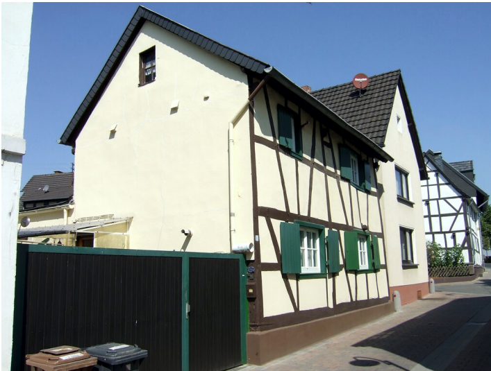
Fachwerkhaus Ahrentaler Straße 1 in Sinzig-Koisdorf (2013)