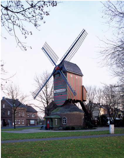
Außenansicht Narrenmühle (2007)