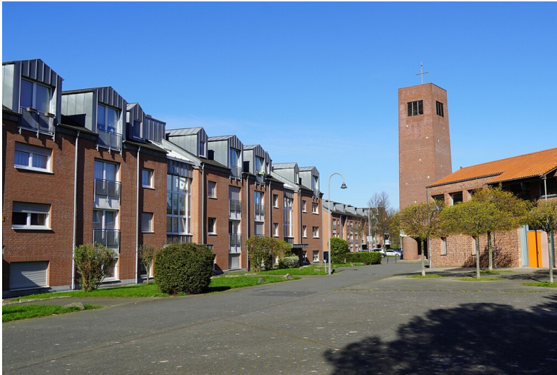
Blick auf Wohnbebauung und die Kirche des Gemeindezentrums St. Katharina von Siena an der Döbrabergstraße / Vogelsbergstraße im Kölner Stadtteil Blumenberg (2023).