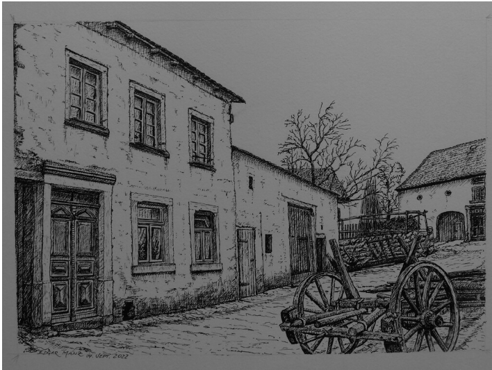
Die Strichzeichnung des Alten Mindisch-Hauses in Berglicht rekonstruiert das Gebäude wie es um 1900 aussah Fotograf/Urheber: Edgar Manz