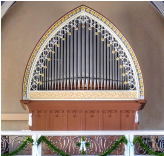
Die Orgel in der Pfarrkirche Sankt Johannes der Täufer in Treis (2022)