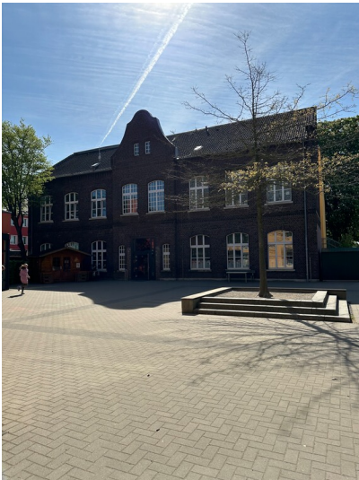
Schulhof und Altbau der Südschule in Krefeld-Fischeln (2023)