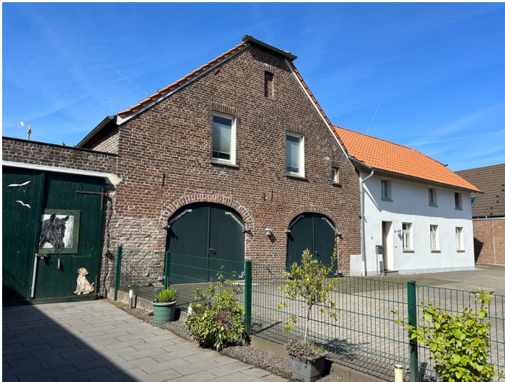
Ehemaliges Damen Gut in Krefeld-Fischeln (2023)