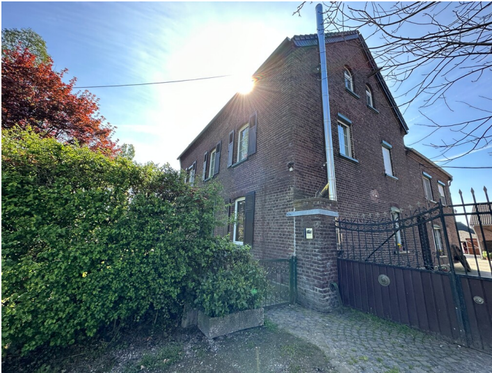
Ketelshof in Krefeld-Fischeln (2023)