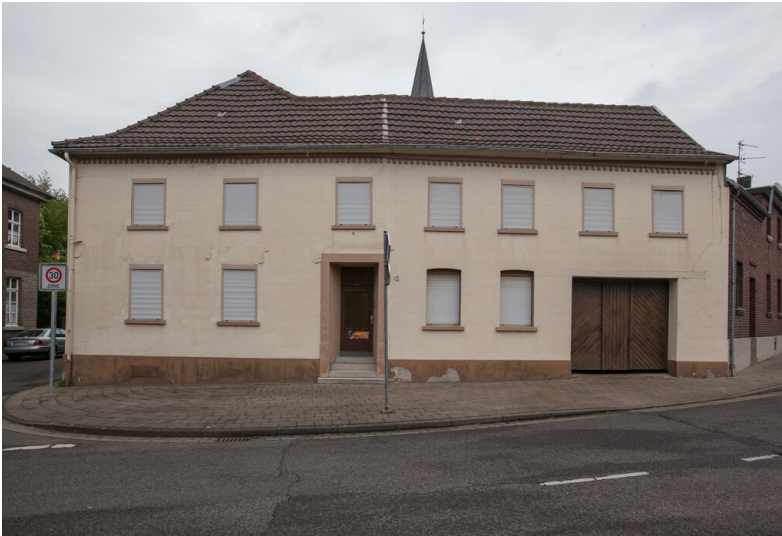
Wohnwirtschaftsanlage mit Tordurchfahrt - Keyenberger Markt 12 in Erkelenz-Keyenberg (2019)