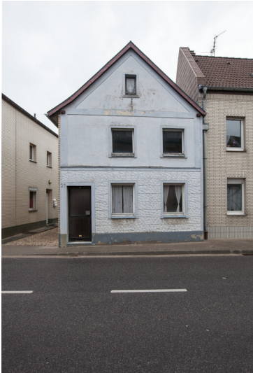
Wohnhaus mit Anbau Borschemicher Straße 21 in Erkelenz-Keyenberg (2019)