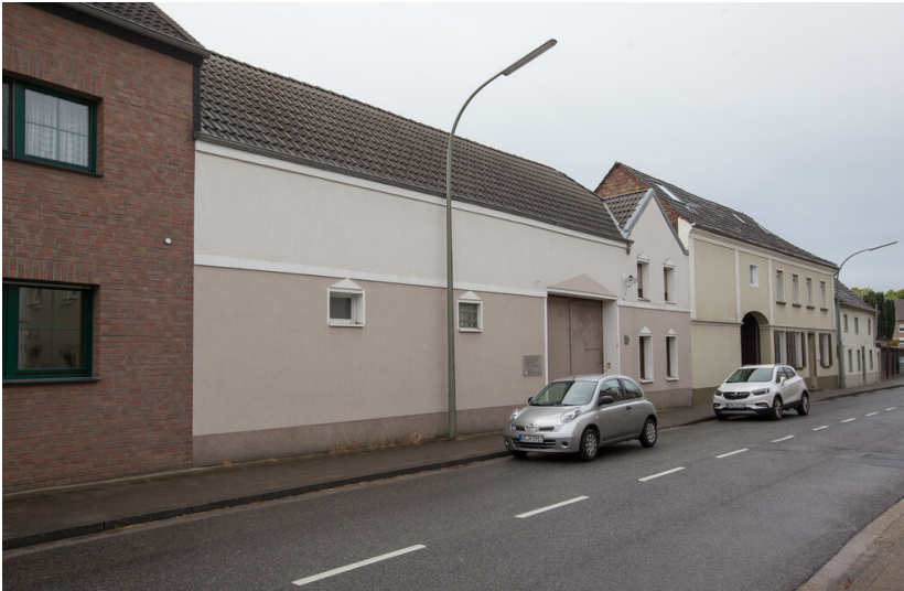
Vierseitige Hofanlage mit Wohnhaus, überbauter Tordurchfahrt und Scheune Borschemicher Straße 8 in Erkelenz-Keyenberg (2021)