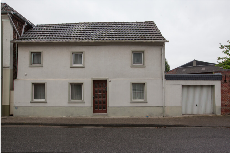
Wohnhaus mit Garage Borschemicher Straße 4 in Erkelenz-Keyenberg (2021)