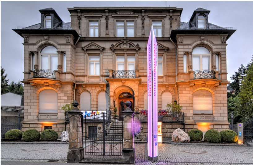
Das Deutsche Edelsteinmuseum in der Hauptstraße 118 in Idar-Oberstein (2022)