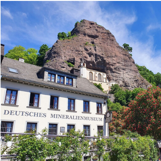
Das Deutsche Mineralienmuseum im Zentrum von Idar-Oberstein (2022)