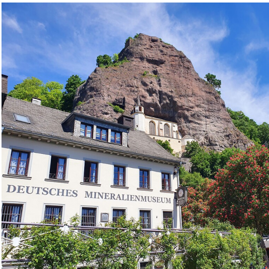
Das Deutsche Mineralienmuseum im Zentrum von Idar-Oberstein (2022)