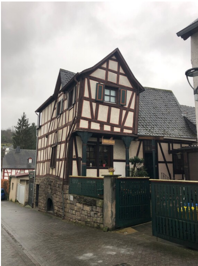
Fachwerkhaus Eulengasse 19 in Sinzig (2024)