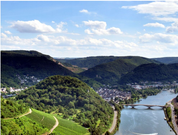
Blick auf den Zillesberg, die Mosel mit der Moselbrücke und den dahinterliegenden Ortsteil Treis (2022)