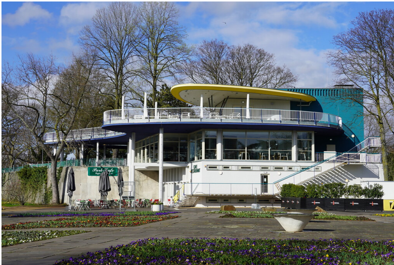
Das Parkcafé im Kölner Rheinpark (2023)