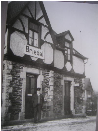
Ehemaliger Bahnhof in Briedel