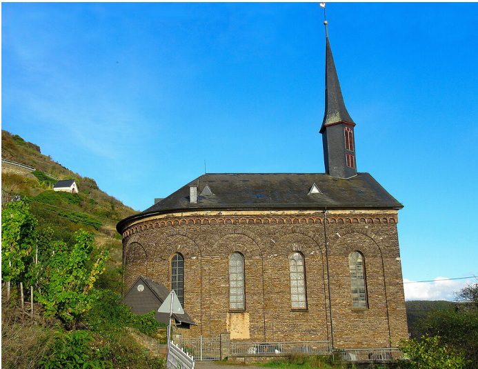
Katholische Filialkirche Sankt Martin in Valwig (2020)