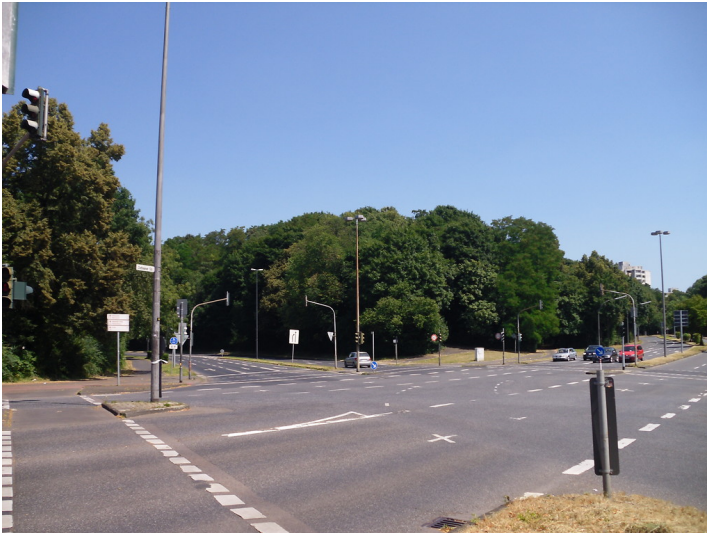
Die Kreuzung Ostheimer Straße/Vingster Ring mit dem Blick auf den begrünten Vingster Berg (2013).