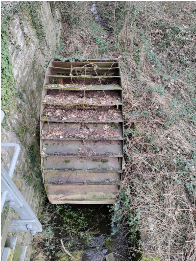
Ehemaliges unterschlächtiges Wasserrad, Allner Mühle, Hennef (2023)