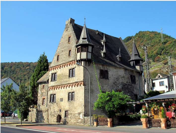
Das Kurfürstliche Amtshaus in Karden (2023)