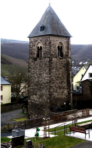
Der Kirchturm der alten Pfarrkirche in Karden, auch Liebfrauen-Turm genannt (2023)