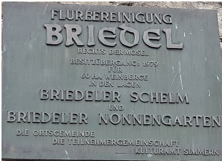
Erinnerungstafel an die Flurbereinigung in Briedel