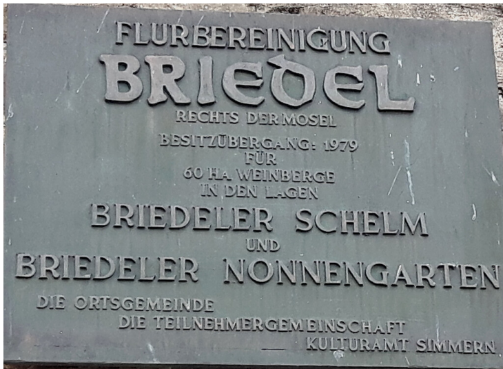
Erinnerungstafel an die Flurbereinigung in Briedel