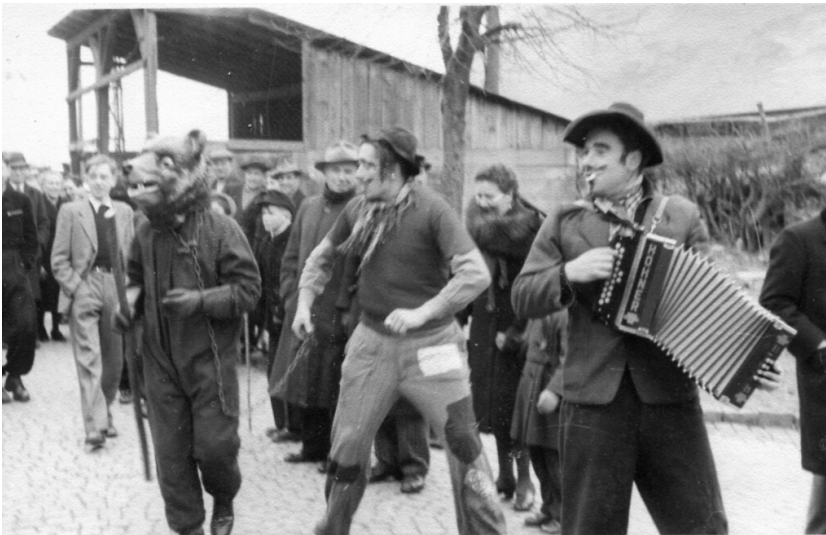
Ehemalige Gemeinschafts-Spritzbrühe-Anlage in Briedel (1950)