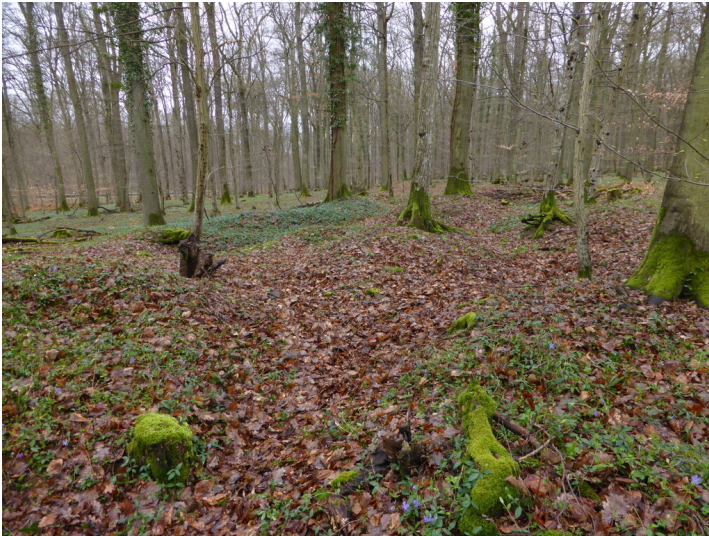
Villa rustica im Grabungsschutzgebiet Harterscheid in Sinzig (2024)